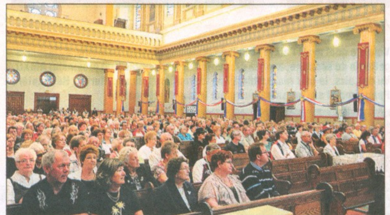
L'église Saint-Mathieu était pleine à craquer.