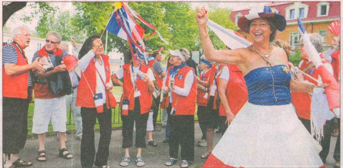
Costumés, drapeaux à la main, accompagnés de musiciens et de deux chars allégoriques, les Acadiens et leurs sympathisants ont joyeusement défilé dans les rues en tapant sur des casseroles. Le Grand tintamarre acadien a rassemblé quelque 350 personnes au plus fort de la parade.