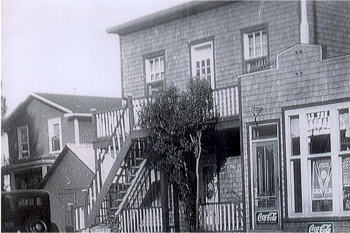
Maison de Stanislas Turbide et premier restaurant vers 1932