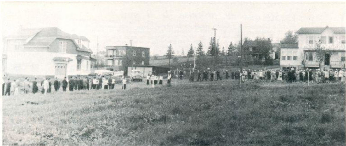
PROCESSION DU TRES SAINT SACREMENT:REPOSOIR CHEZ M.EUSEBE TURBIDE